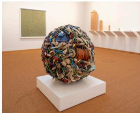
'Gordianse knoop', een kluwen van kabels, touwen en buizen.

De route, met het FeliXart & Eco Museum en het Huis van Herman