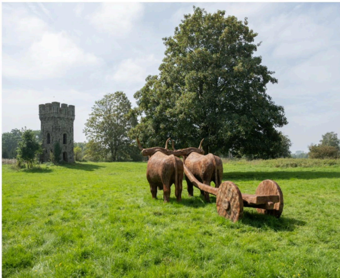
'The voyage' van Atelier Van Lieshout in het Malakoffdomein.

kort in de steigers staan als bedrijfsparc.