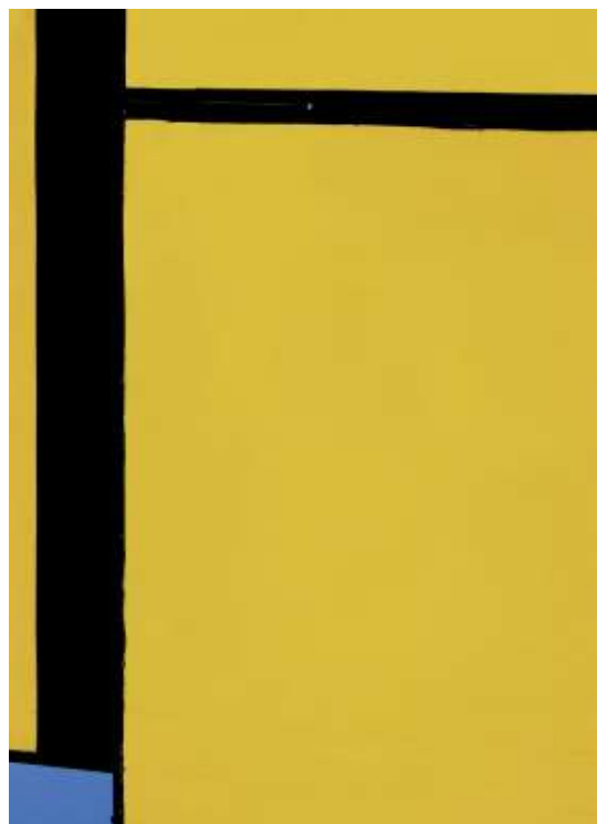
Artur Eranosian Nr 1, 2016