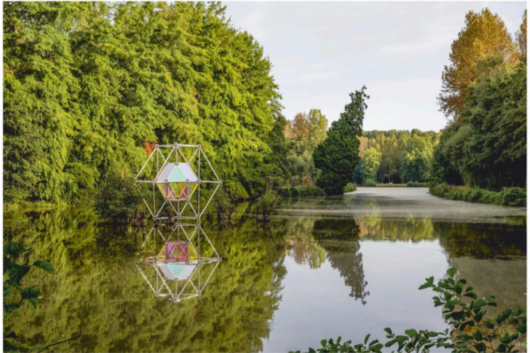
De Zenne loopt dwars door kasteeldomein Calmeyn, waar ook kunst te bezichtigen is.

Niet onverwacht zitten er op die manier ook heel wat klimaatzorgen verwerkt in de kunstwerken, en dat komt extra binnen als